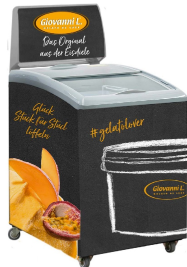
Abb.: IC155DL im Kundendekor (Modell IC155D mit Leuchtkasten)

Änderungen für Ausführungsmerkmale und technische Daten vorbehalten!