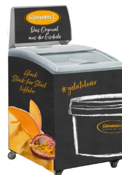
Abb.: IC155DL im Kundendekor (Modell IC155D mit Leuchtkasten)